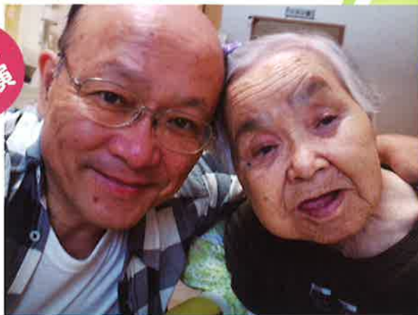
ペコロスの母に会いに行った日々